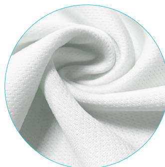
C | Coolmax® F02 lekki, szybkoschnący poliester z perforacją w drobne oczka 130g/m 2