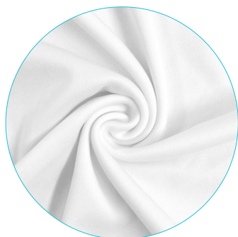
A | gładki, lekki poliester 130g/m 2