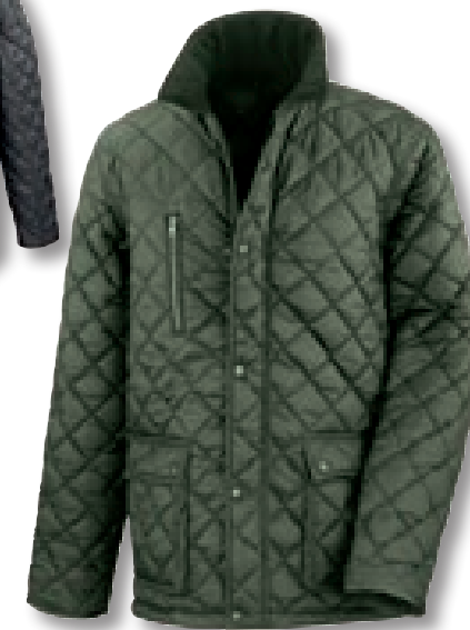
OLIVE (448) VERFÜGBAR AB DEN 1. JULI 2014