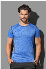
ST8840 Recycled Sports-T Reflect