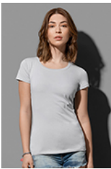
ST9700 Claire Crew Neck